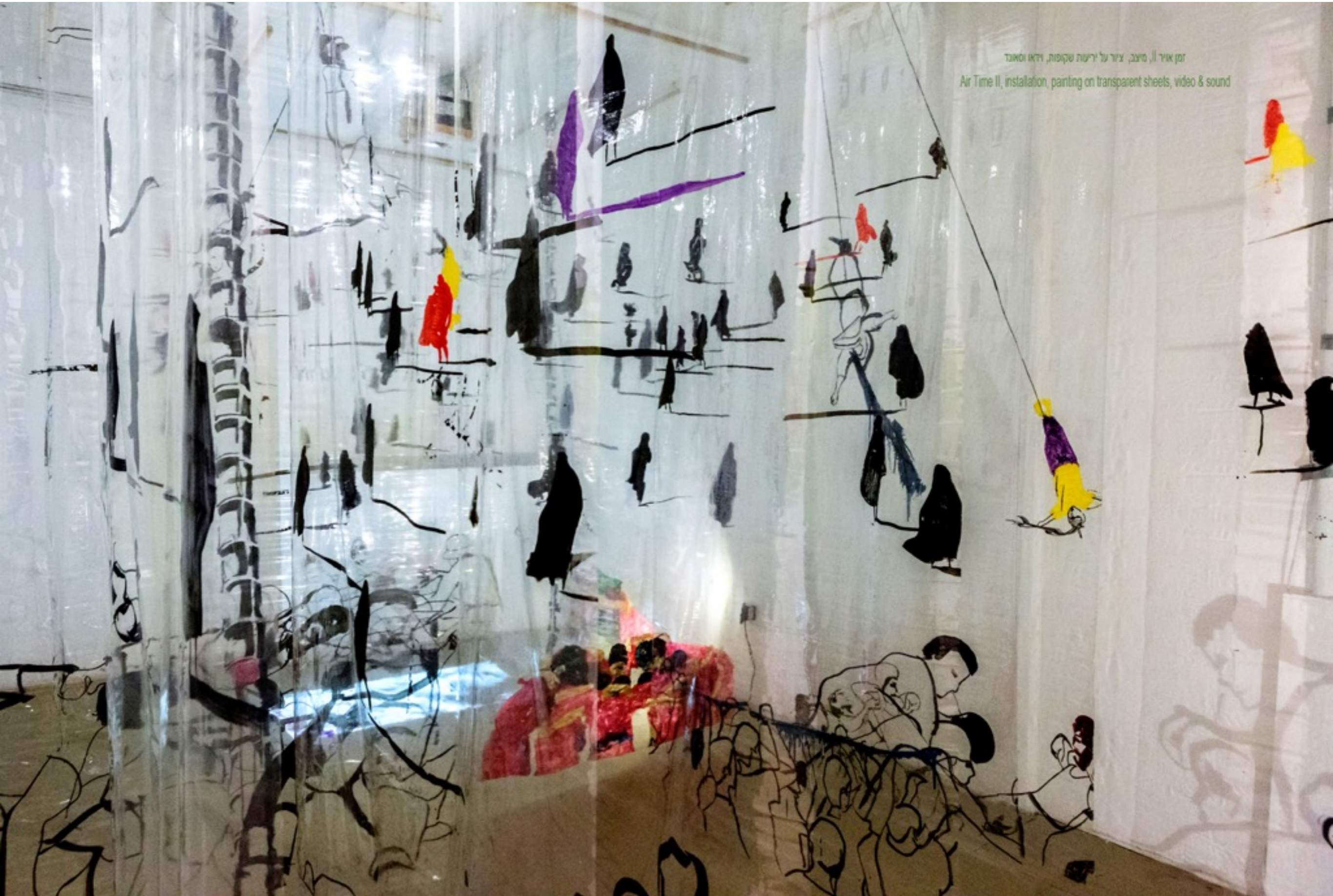
זמן אוויר II, מיצב, ציור על זרזועות שקופות, וידאו וסאונד Air Time II, installation, painting on transparent sheets, video & sound