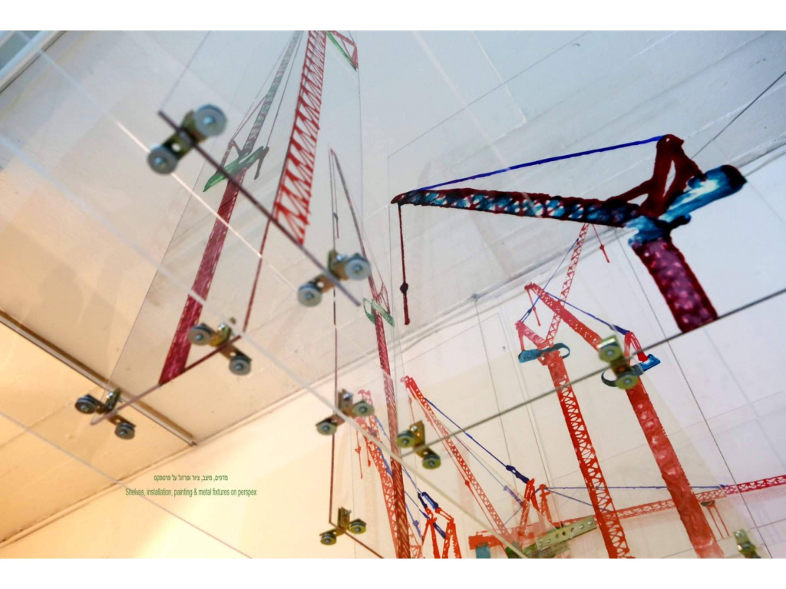
מדפים, מיצב, ציור ופרזול על פרספקס Shelves, installation, painting & metal fixtures on perspex