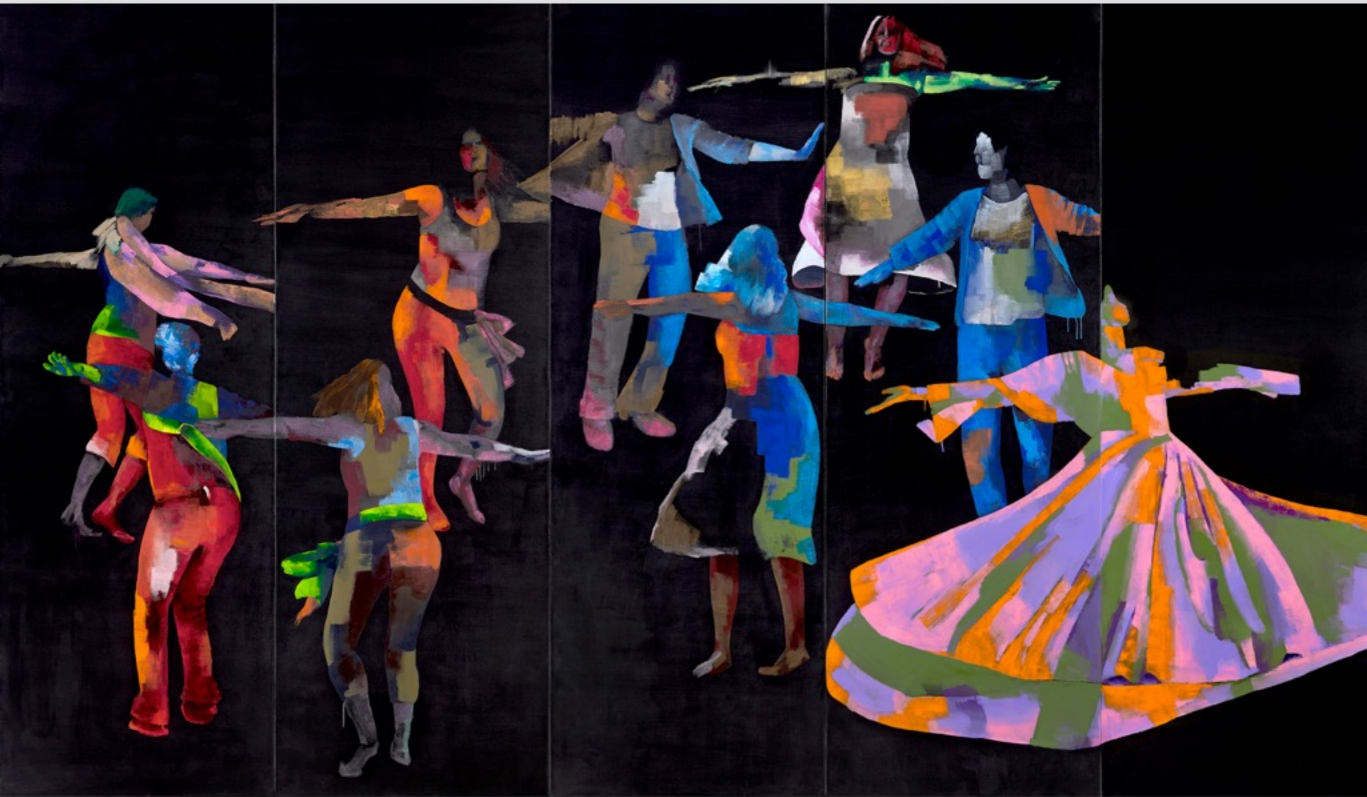
Spinning, 2017, Acrylic on canvas, 230*400 cm