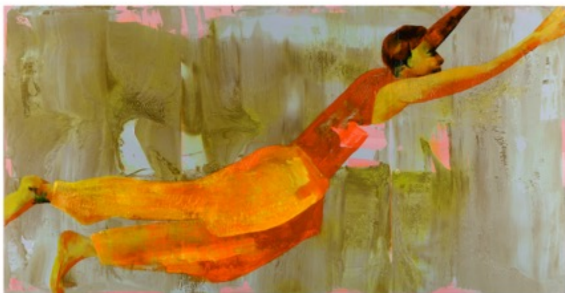
Free (3 & 4), 2015, Oil on canvas, 90*180