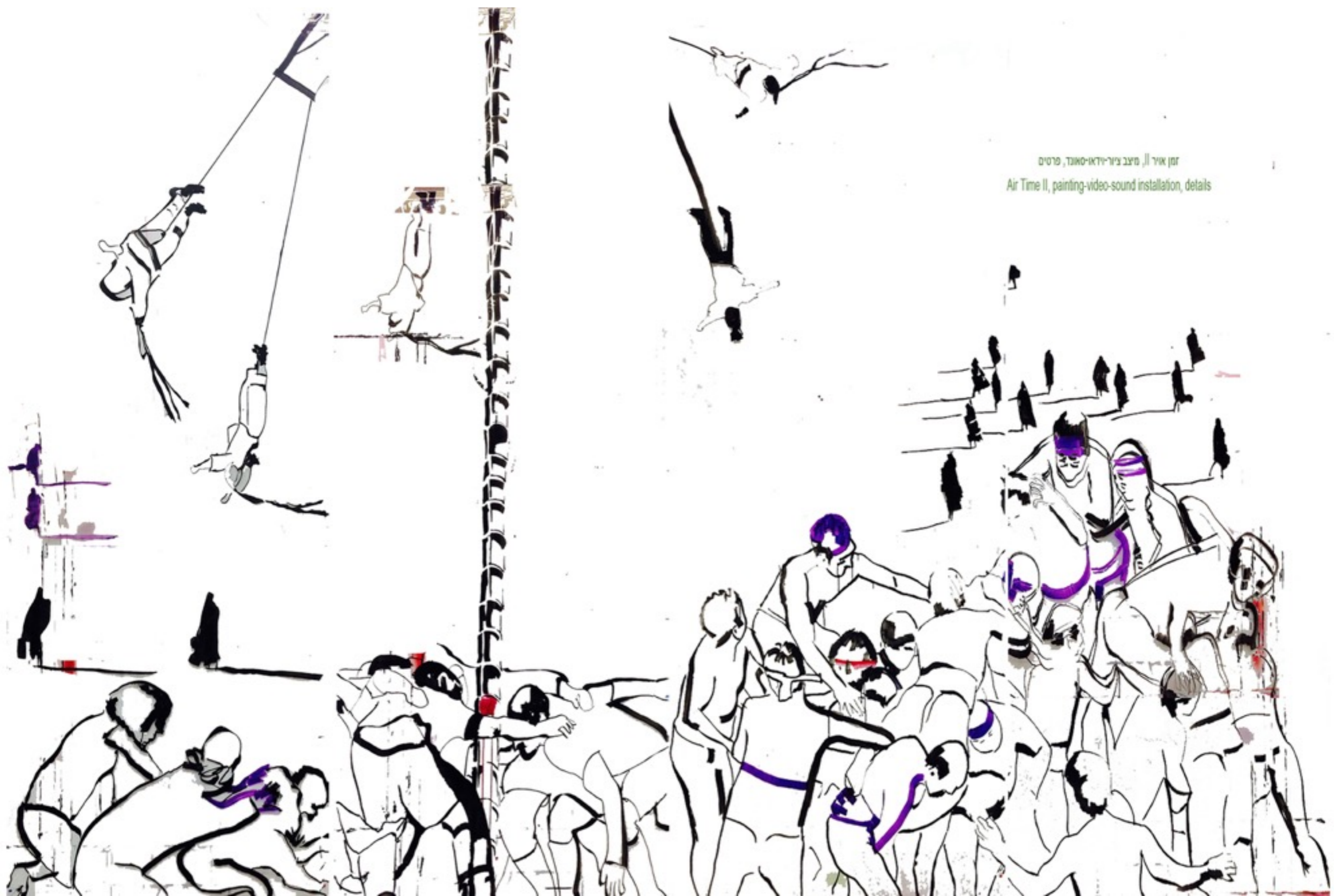
זמן איר II, מיצב ציור-וידאו-סאונד, פרטים Air Time II, painting-video-sound installation, details