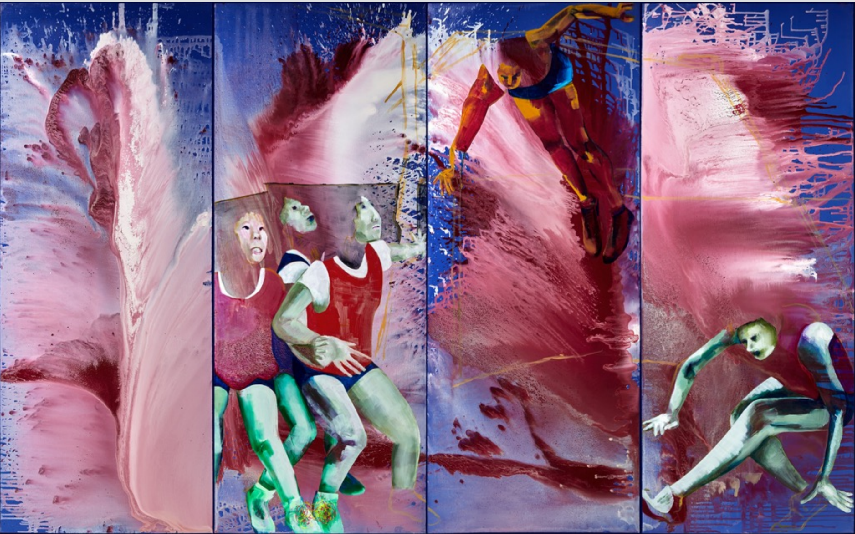
Cranes, 2017, Oil on canvas, 200*320 cm